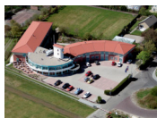
Fletcher Duinhotel Burgh Haamstede **** (Burgh Haamstede)

Bei der Auswahl der Unterkunft versuchen wir so weit wie möglich einen sicheren und geschlossenen Fahrradschuppen zu berücksichtigen. Allerdings können wir dies nicht bei allen Unterkünften garantieren und dies hängt teilweise von der Anzahl der Fahrräder anderer Gäste ab.