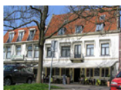
Hotel Restaurant Die Port van Cleve *** (Enkhuizen)