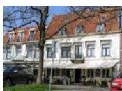
Hotel Restaurant Die Port van Cleve *** (Enkhuizen) www.deportvancleve.nl