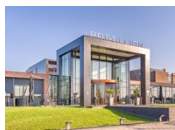
Postillion Hotel Bunnik *** (Bunnik)

Bei der Auswahl der Unterkunft versuchen wir so weit wie möglich einen sicheren und geschlossenen Fahrradschuppen zu berücksichtigen. Allerdings können wir dies nicht bei allen Unterkünften garantieren und dies hängt teilweise von der Anzahl der Fahrräder anderer Gäste ab.